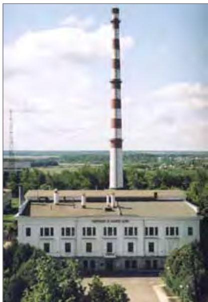
Первая в мире атомная промышленная электростанция в Обнинске

Каждая атомная станция разработана и пущена с участием Курчатовского института. Атомная станция – сложнейший технологически, гигантский объект. Это сотни систем, работающих одновременно. Но сердце атомного энергоблока – ядерный реактор. Курчатовский институт – научный руководитель их проектирования и установки. Мы рассчитываем параметры этих реакторов, их активных зон, ядерного топлива.