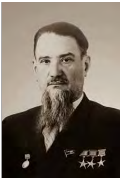
Игорь Васильевич Курчатов

Поочередно были собраны четыре сборки (это сотни тонн графита), одновременно строили здание для реактора. В его котловане была собрана финальная пятая сборка, которая и стала 25 декабря 1946 г. тем самым легендарным реактором Ф-1 – «Физическим первым». На осуществление этого грандиозного проекта понадобилось всего 16 месяцев! С тех пор Курчатовский институт в авангарде создания новых реакторов. Хорошо известна сказанная Курчатовым сразу же после пуска фраза: «Атомная энергия теперь подчинена воле советского человека».