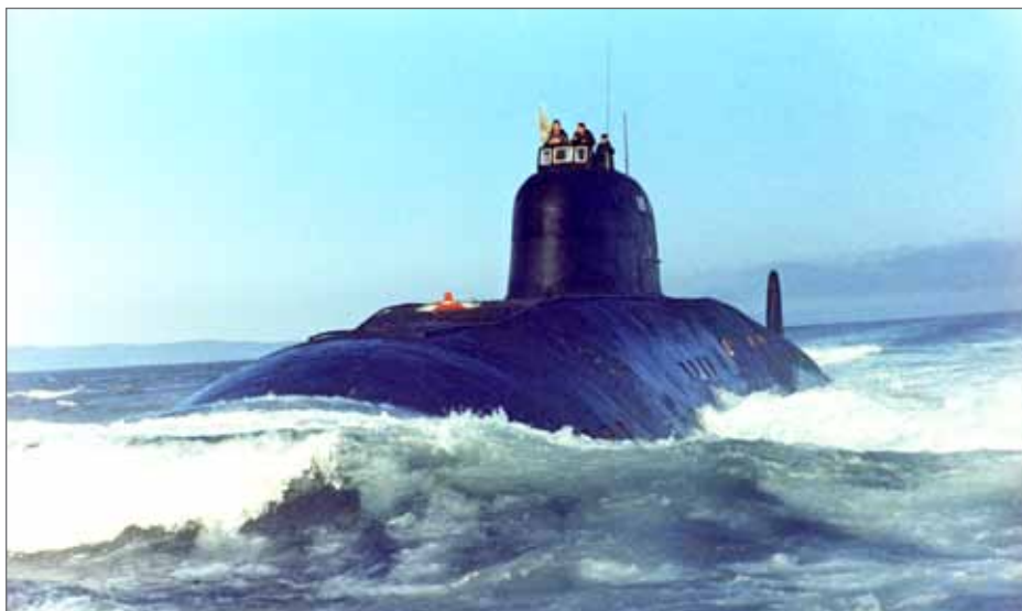
Первая в СССР атомная подводная лодка «Ленинский комсомол»