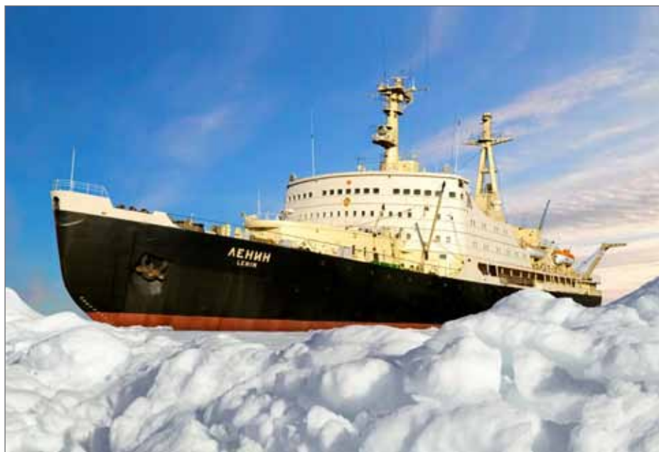
Первый в мире атомный ледокол «Ленин»