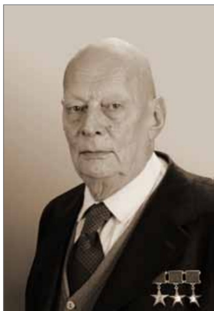
Анатолий Петрович Александров

ческая техника, инфокоммуникационные технологии, новое материаловедение, ядерная медицина – вот далеко не полный перечень отраслей техники и технологий, рождённых Атомным проектом. В результате осуществления советского Атомного проекта были созданы практически все основные отрасли научно-технологического комплекса, которые сформировали новый геополитический облик СССР как мировой сверхдержавы. Эти отрасли и сегодня обеспечивают национальную безопасность и устойчивое положение нашей страны в группе мировых технологических лидеров.